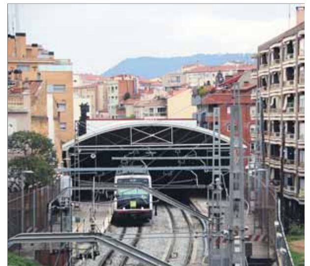
La línia travessa Manresa i es vol fer subterrània