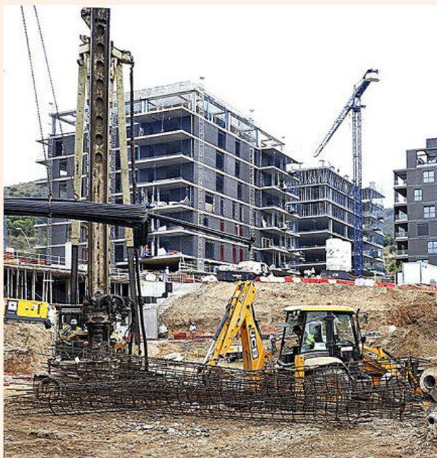
En toda Catalunya se visaron menos de 12.000 viviendas en 2020.

El importante descenso registrado en Barcelona se explica en parte por el impacto de la pandemia del Covid-19. El estado de alarma provocó un frenazo en todos los segmentos de la construcción y la actividad sólo se recuperó hacia finales de año. Sin embargo, los datos de la capital catalana son mucho peores que