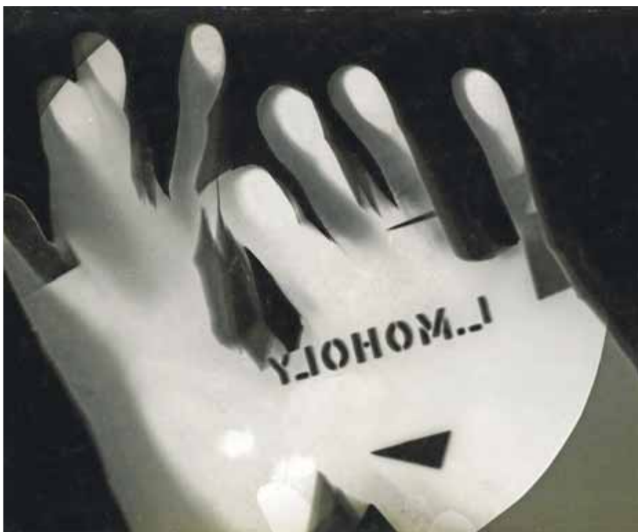
'Ohne Titel' (1925), un dels fotogrames de László Moholy-Nagy que s'exposen a la sala La Cova del Col·legi d'Arquitectes de Girona

El COAC s'acosta als experiments fotogràfics del mestre de la Bauhaus