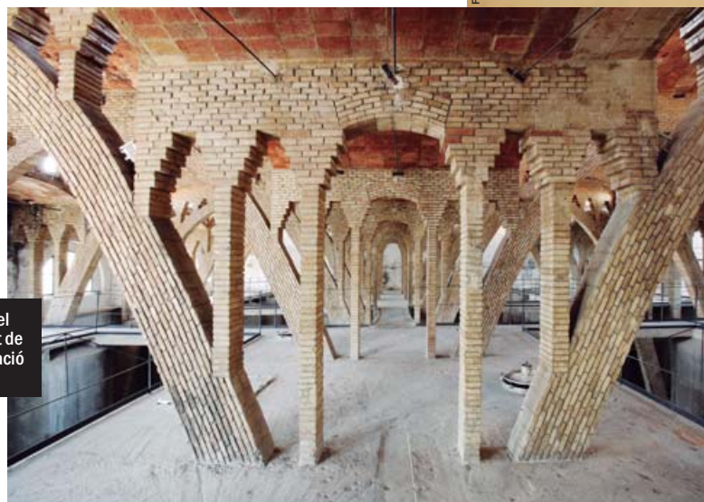
Cellar del Sindicat de Cooperació Agrària