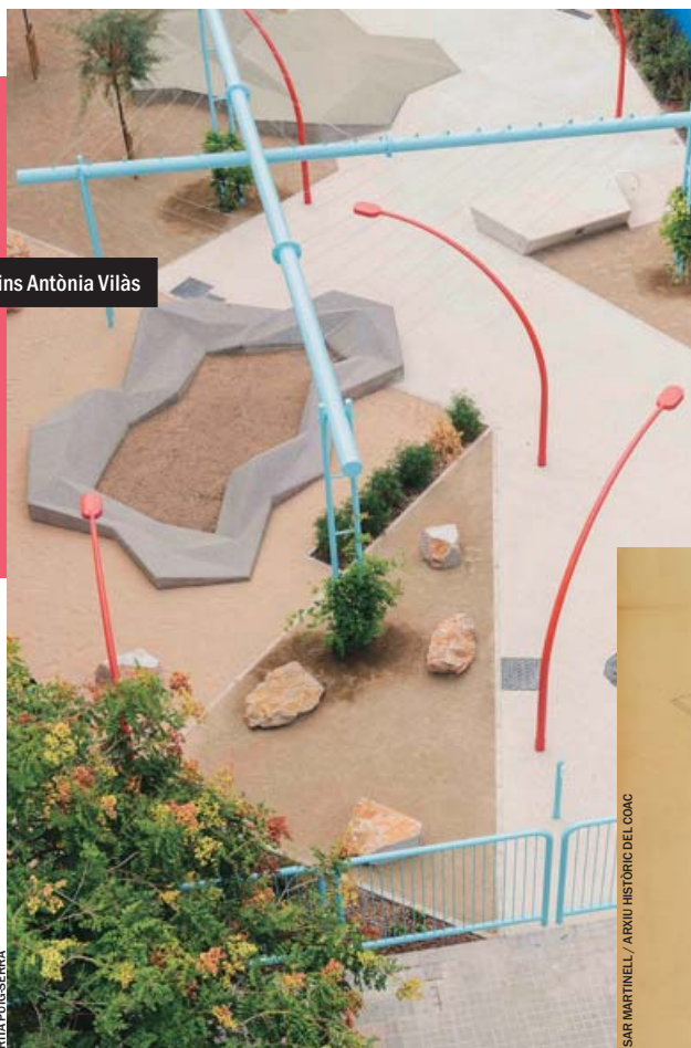
Jardins Antònia Vilàs

La plataforma permet navegar de forma lúdica, però també ofereix una visió completa dels projectes i vol esdevenir un referent per a la investigació; de cada obra es presenta una memòria, l'autor (la presència d'arquitectes dones és inferior, fet que demostra que