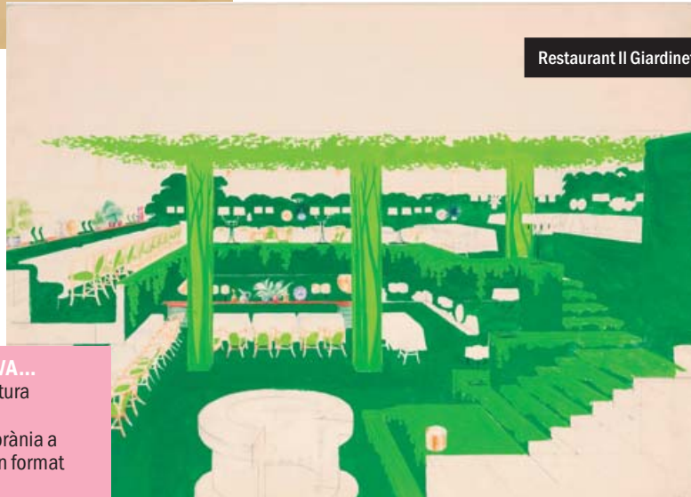
Restaurant Il Giardinetto