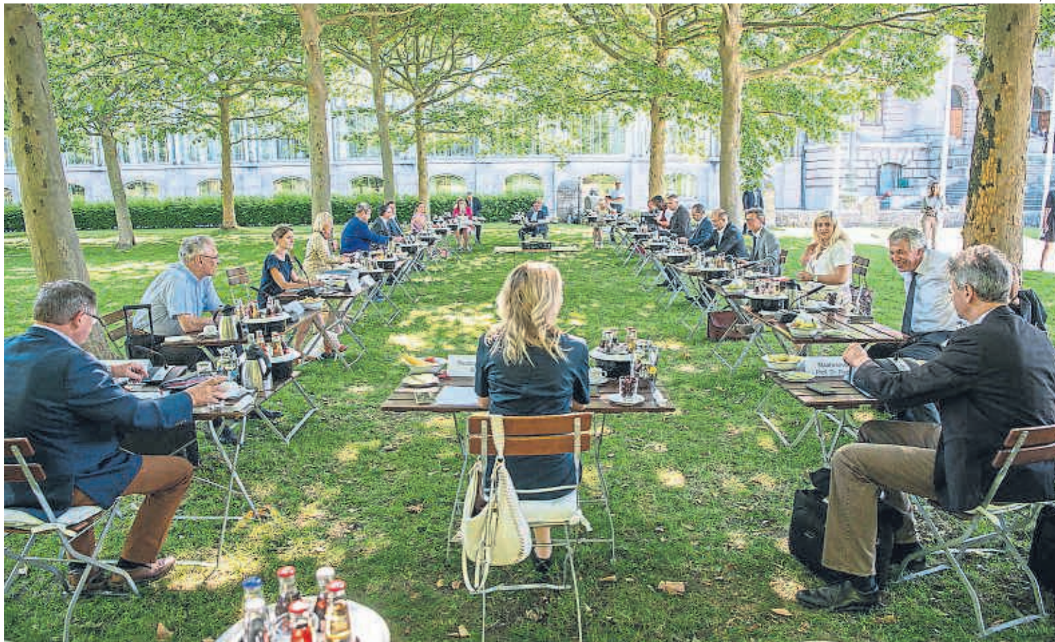
REUNIÓ A L'AIRE LLIURE. El bon temps a Baviera, Alemanya, ha propiciat que el Govern del land alemany més afectat per la Covid-19 faci la junta de Gabinet al jardí de la cancelleria respectant la distància de seguretat.