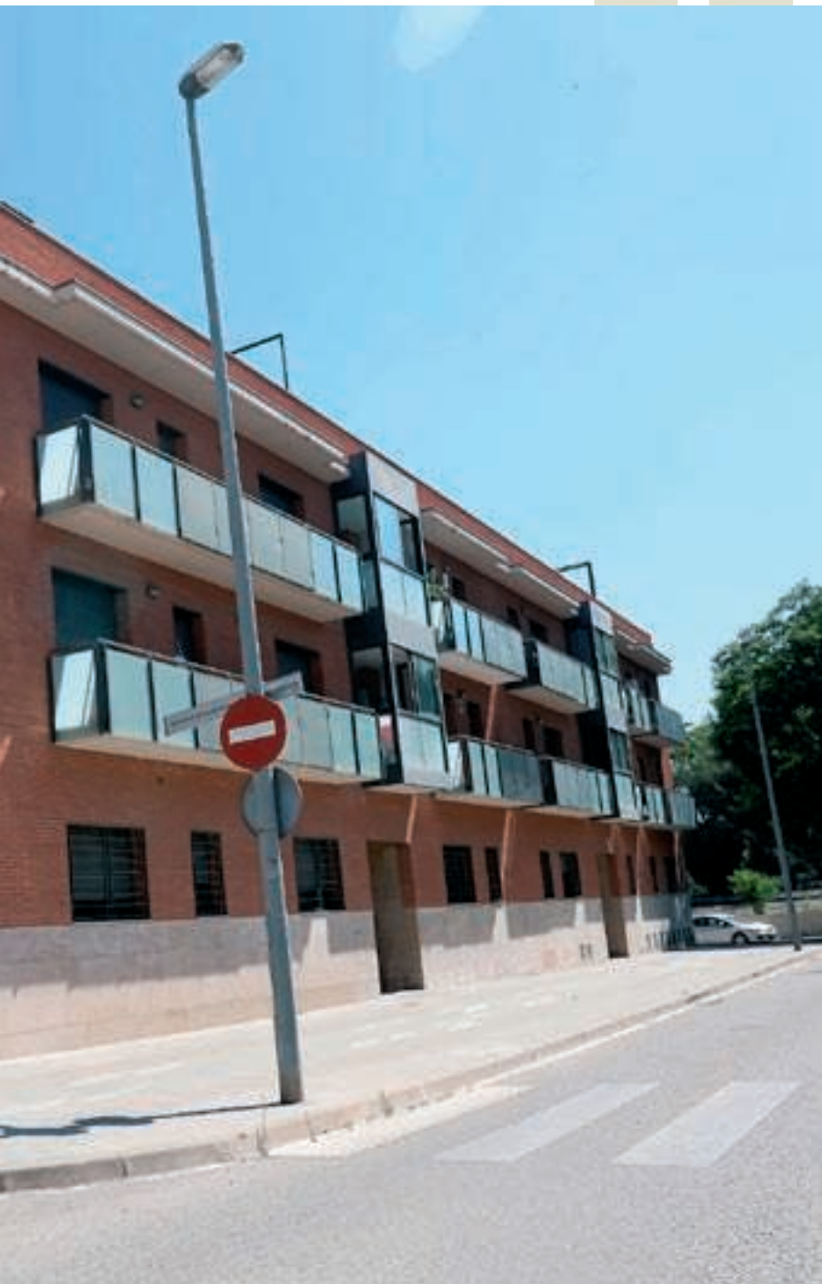
GRÀFIC: NEUS PÀEZ