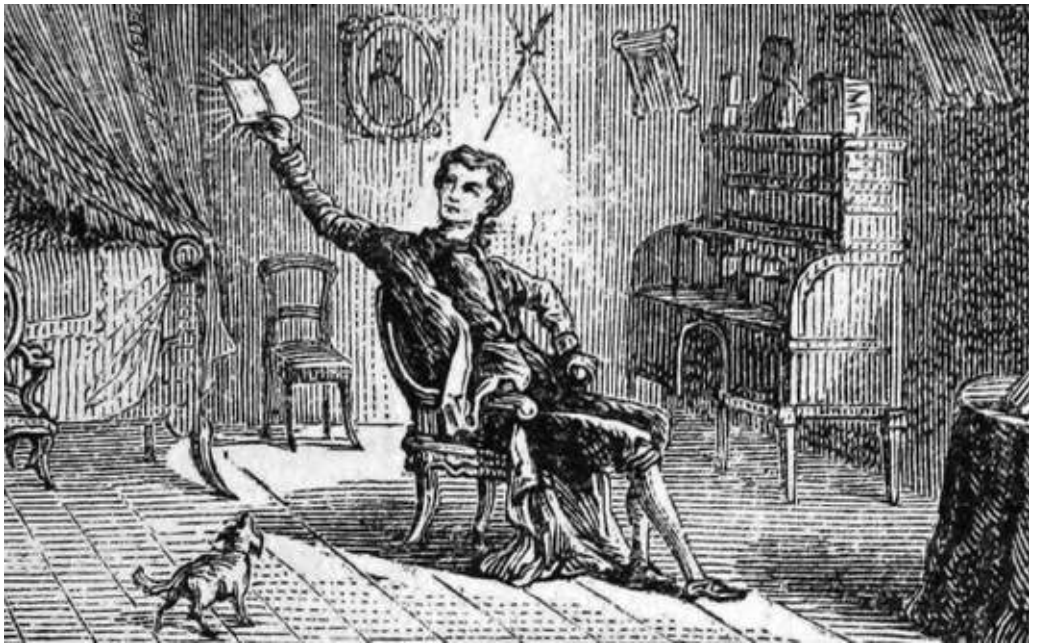
Xavier de Maistre, confinat a casa, va viatjar al voltant de les coses que tenia a l'habitació.

Petrarca, que és considerat falsament el primer excursionista d'Europa perquè va pujar sense cap propòsit evident el Mont Ventós, als estreps dels Alps francesos (1.909 metres d'altura), va deixar-nos una molt imaginativa descripció de l'experiència en una carta adreçada a Dionigi da Borgo San Sepolcro —que no va arribar a llegir-la perquè es va morir abans, atès que Petrarca va treballar-hi l'estil entre un esborrany de 1342 i la versió definitiva, de l'any 1353—, la qual inclou el fet que havia agafat, per fer l'excursió més passadora, les Confessions de sant Agustí i que, per un atzar que és pura inventiva, en ser obert aquest llibre durant el camí, va llegir-hi aquesta frase, que reporto: "Els homes viatgen per admirar l'altura de les muntanyes, les grans onades del mar, els corrents amplis dels rius, la immensa latitud dels oceans, els