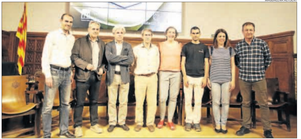
Participants ahir a l'IEI en el debat organitzat pel Col·legi d'Arquitectes de Catalunya.

Premi Ignasi Miquel. L'exposició dels projectes pot visitar-se fins aquest diumenge. L'acte va culminar amb un debat sobre la situació actual de l'arquitectura a Lleida.