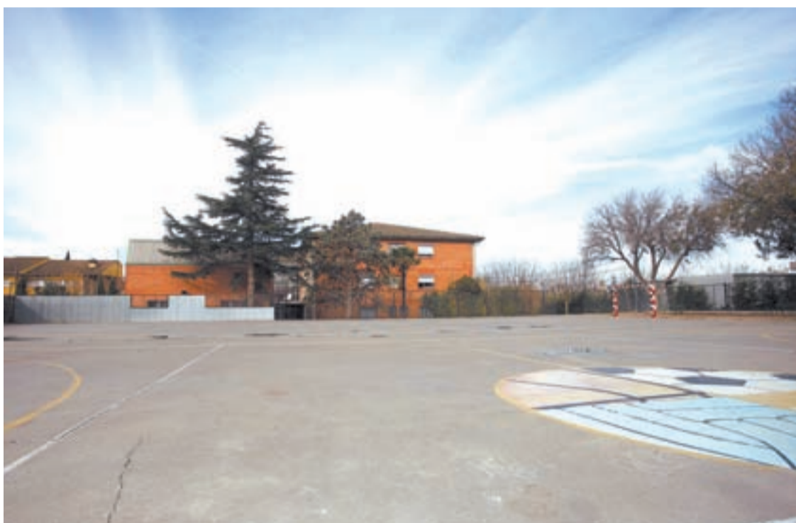
El centre educatiu Alfons Costafreda, a Tàrrrega, on es faran actuacions noves

Pel que fa a Lleida, paral·lelament a les noves actuacions, el Departament d'Educació ja està impulsant al territori un total de 4 actuacions amb un import de 15.561.511 euros, que són obres que actualment està construint o bé que ja compten amb disponibilitat pressupos-