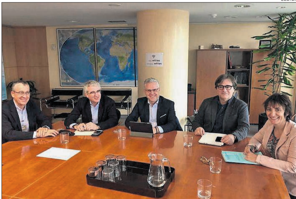
Imatge de la darrera reunió paritària entre responsables de l'Ajuntament i de la Generalitat.

Els tràmits per tirar endavant les obres del barranc de Barenys segueixen el calendari previst, d'acord amb el que es va informar durant la darrera reunió de la comissió tècnica paritària entre Ajuntament de Salou i la Generalitat. Aquesta setmana s'ha reunit a Territori i Sostenibilitat la comissió tècnica que tira endavant aquest projecte i s'ha constatat que, segons l'Agència Catalana de l'Aigua, de cara al mes de juny, ja hi haurà damunt la taula l'aprovació definitiva del projecte de desviament de Barranc de Barenys. A hores d'ara, es mantenen els calendaris: el mes de juny estarà aprovat definitivament el projecte que s'enviarà a l'Ajuntament per tal d'iniciar la