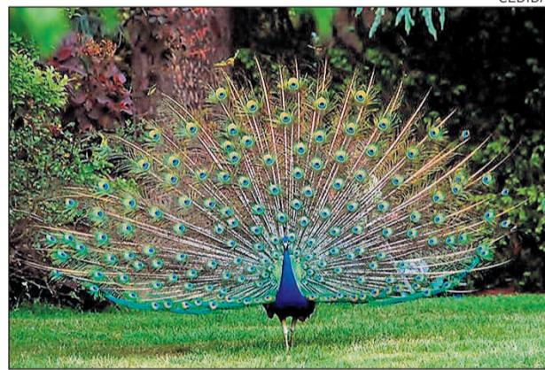
Hi haurà una visita guiada per observar alguns dels ocells.