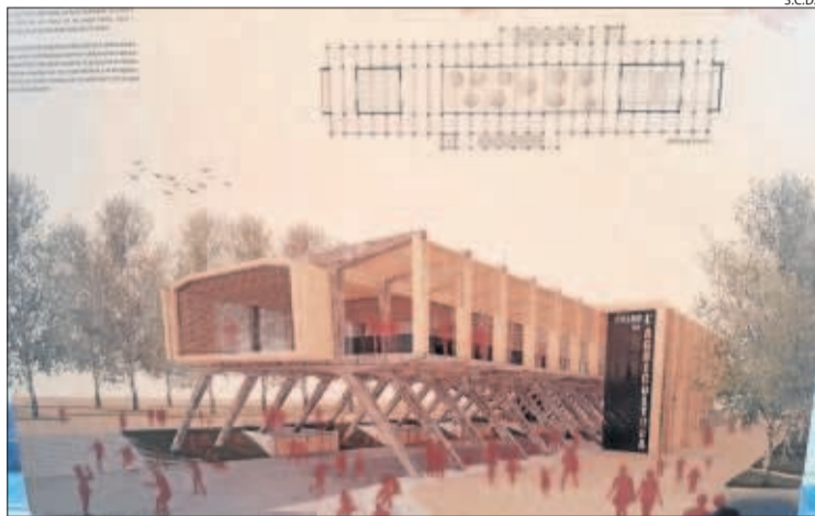
Una de les propostes planteja fer un 'Palau de l'Agricultura'.

La majoria de les deu propostes sobre el seu futur mantenen l'estructura però deixen la planta baixa sense vidriera || Podran votar-se fins al 3 de maig