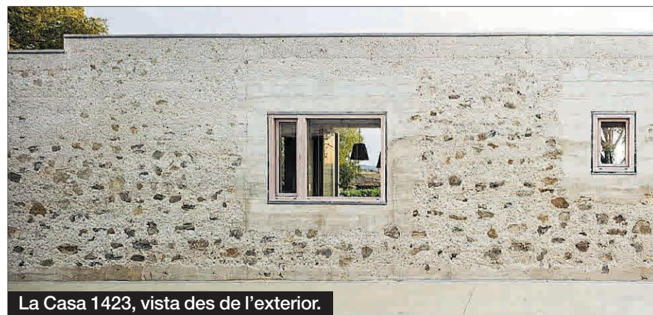
La Casa 1423, vista des de l'exterior.