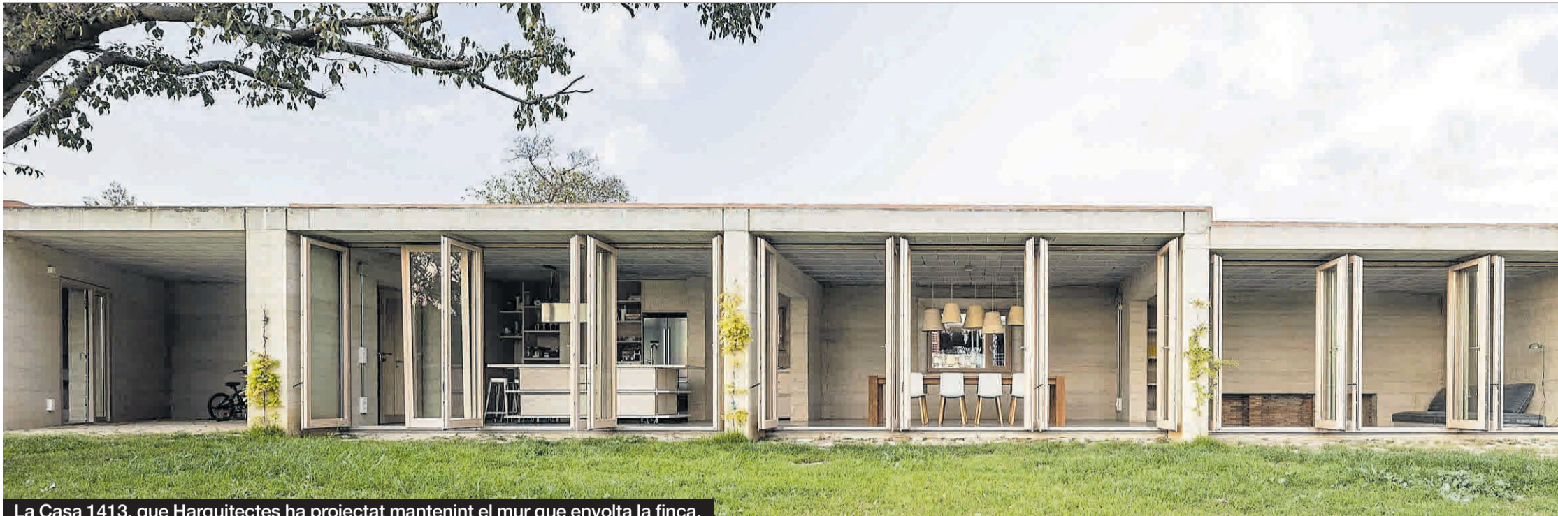
La Casa 1413, que Harquitectes ha projectat mantenint el mur que envolta la finca.