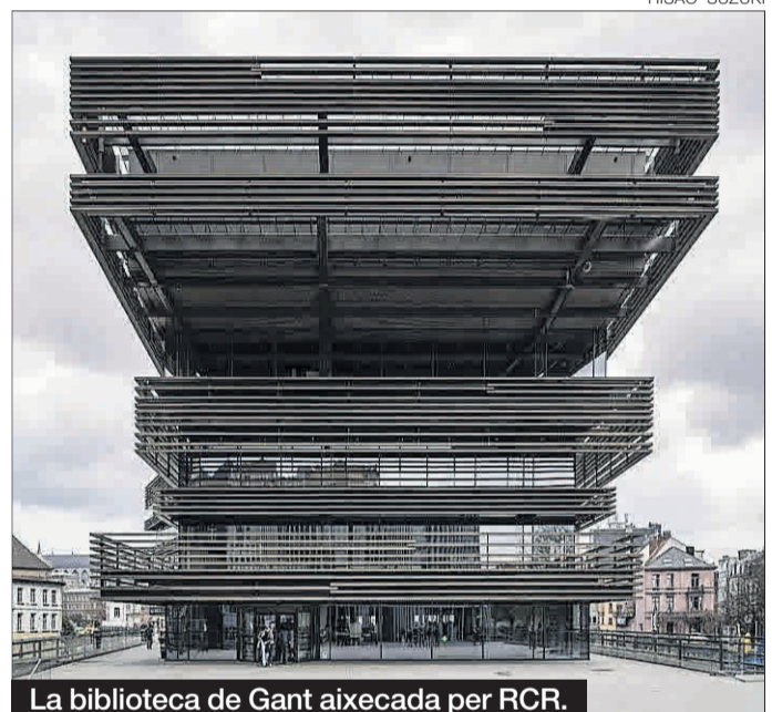
La biblioteca de Gant aixecada per RCR.